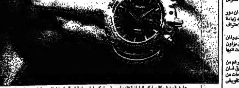
مراجعة من شركة سافير اليابانية... صورة من شركة سافير اليابانية...